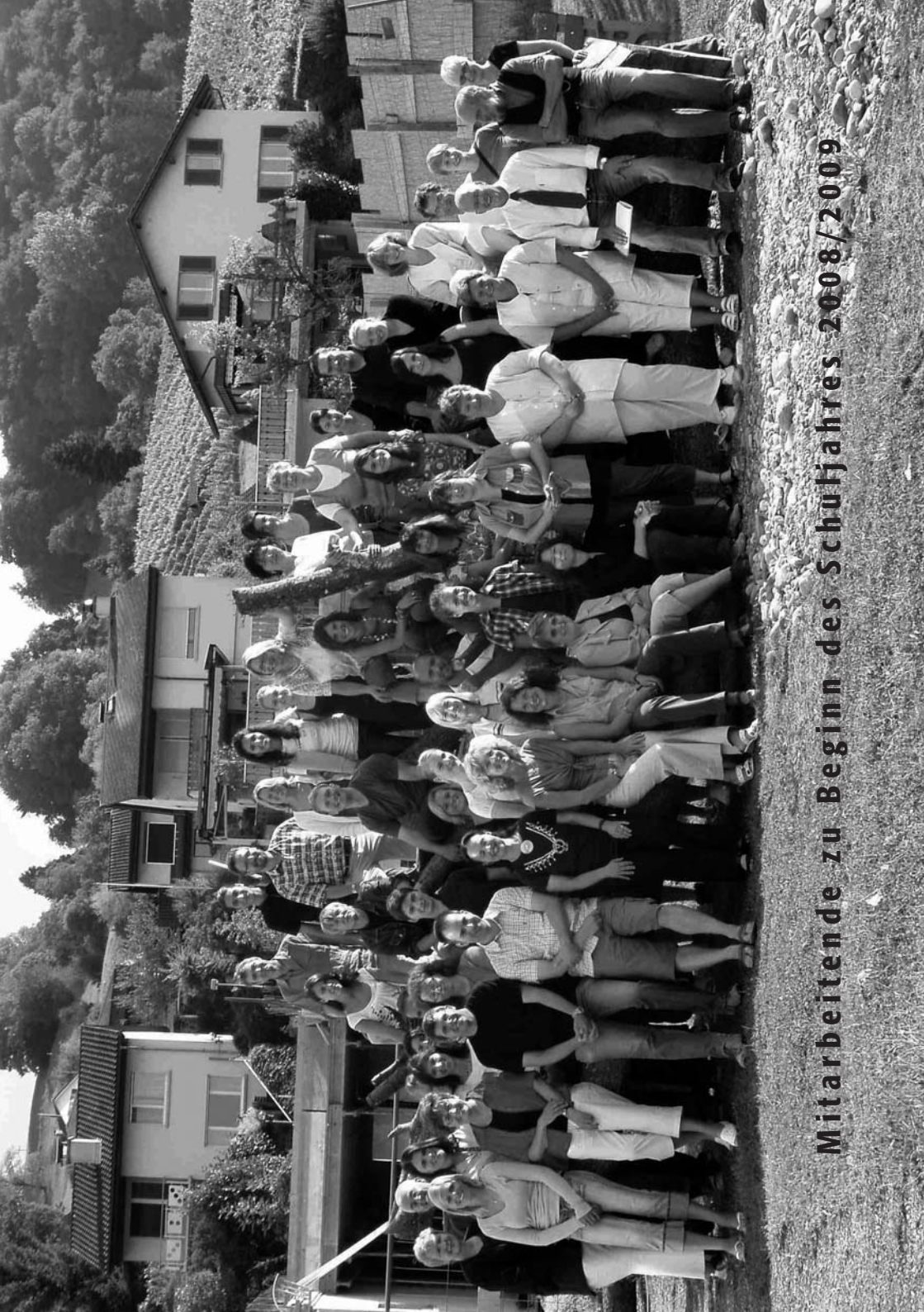
Mitarbeitende zu Beginn des Schuljahres 2008/2009